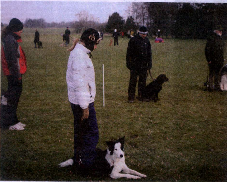
Det koster 510 kr. at melde sig til et kursus i lydighed, men så får man også langt mere fornøjelse af sin hund.