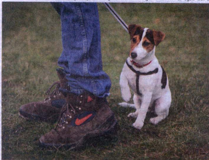
Selv om man ikke er meget større end tobak for en skilling - eller en sko - skal man stadig lære at lyste.

I mandags var der dyrslægeaften i Kulturhuset. Omkring 100 medlemmer mødte op for at blive lidt kløgere.